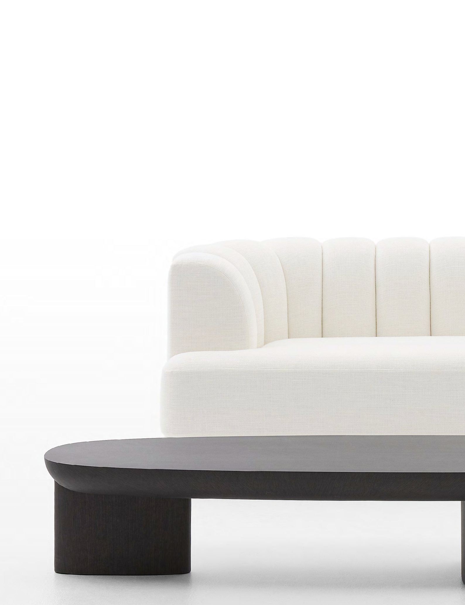
La table basse JIMMY 160 cm devant le canapé BOUDOIR 220 cm