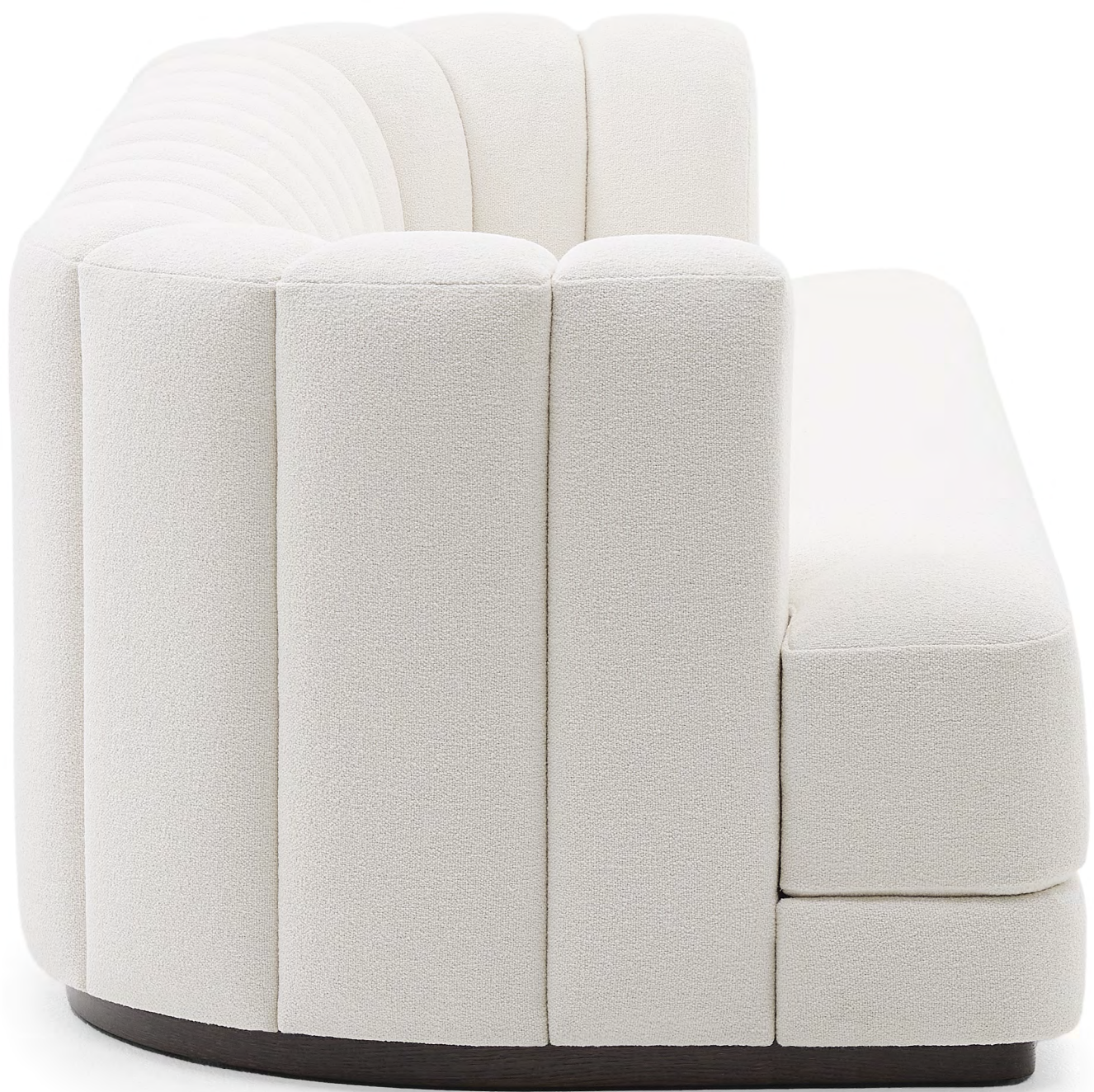
BOUDOIR Canapé / Sofa, FBOUDCA260B2 Piètement Chêne Wengé Satiné CO007S / Oak Wenge Satin Finish