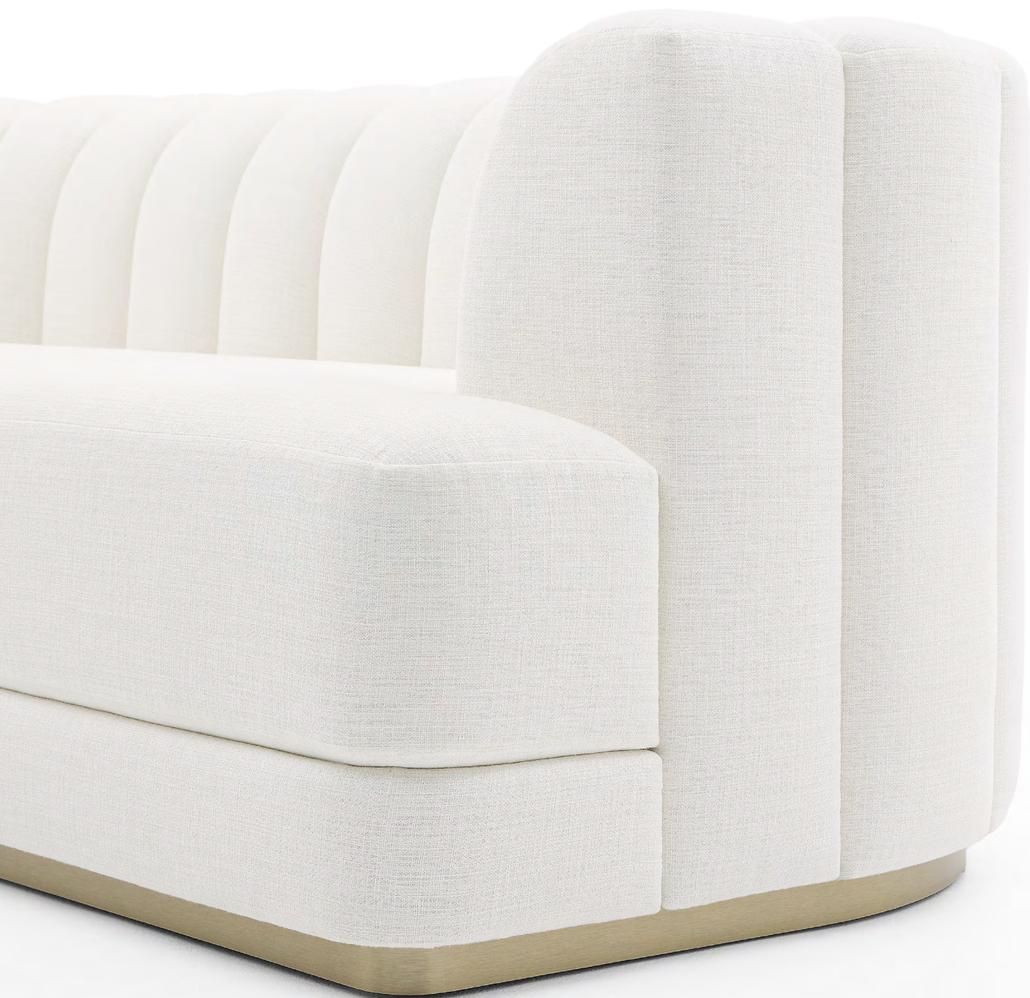
BOUDOIR Canapé / Sofa FBOUDCA220M, Piètement Métal M104BRO Bronze brossé / Metal Base Brushed Bronze