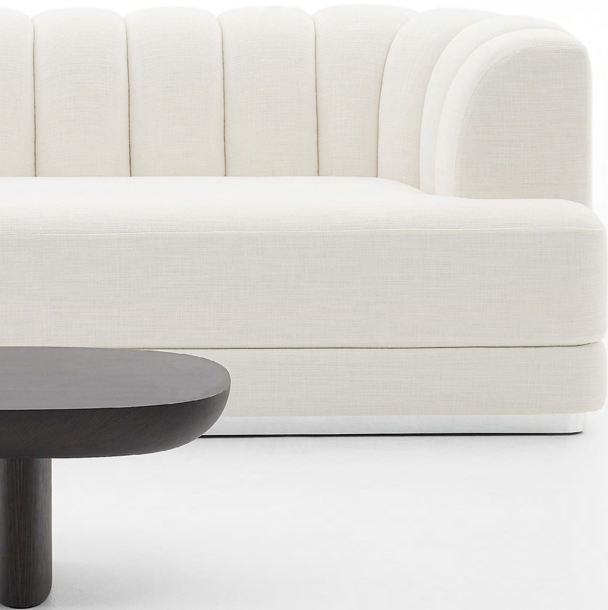
BOUDOIR Canapé / Sofa FBOUDCA220M1 Piètement Métal M100B Aluminium brillant / Metal Base Shiny Aluminium