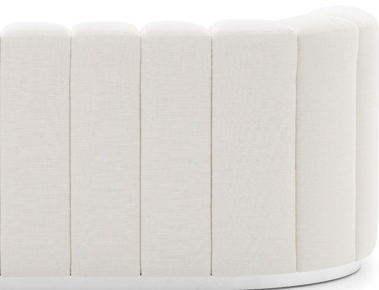
BOUDOIR Canapé / Sofa FBOUDCA220M1 Piètement Métal M100B Aluminium brillant / Metal Base Shiny Aluminium