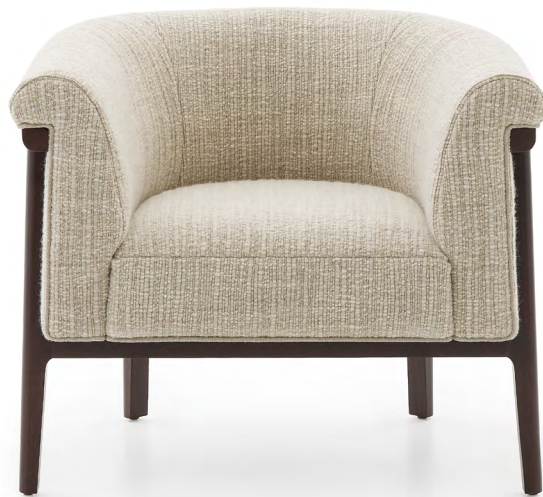
ALTO Fauteuil - Armchair FALTOFA083