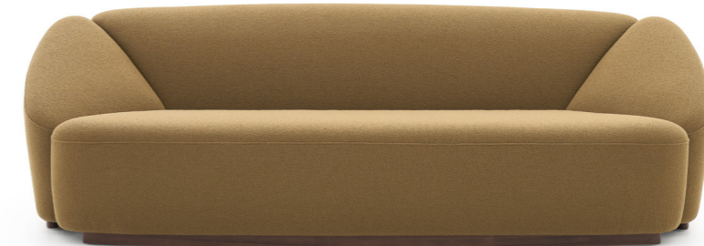
TRÈFLE Canapé - Sofa FTRECA240