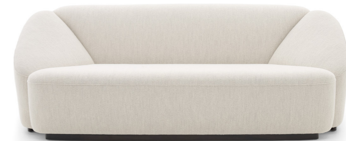
TRÈFLE Canapé - Sofa FTRECA200

With its refined aesthetic and primary geometric forms, TRÈFLE achieves a delicate balance of artistry and practicality. The result is a sculptural yet understated masterpiece that enhances both comfort and style, redefining the living space with elegance and grace.