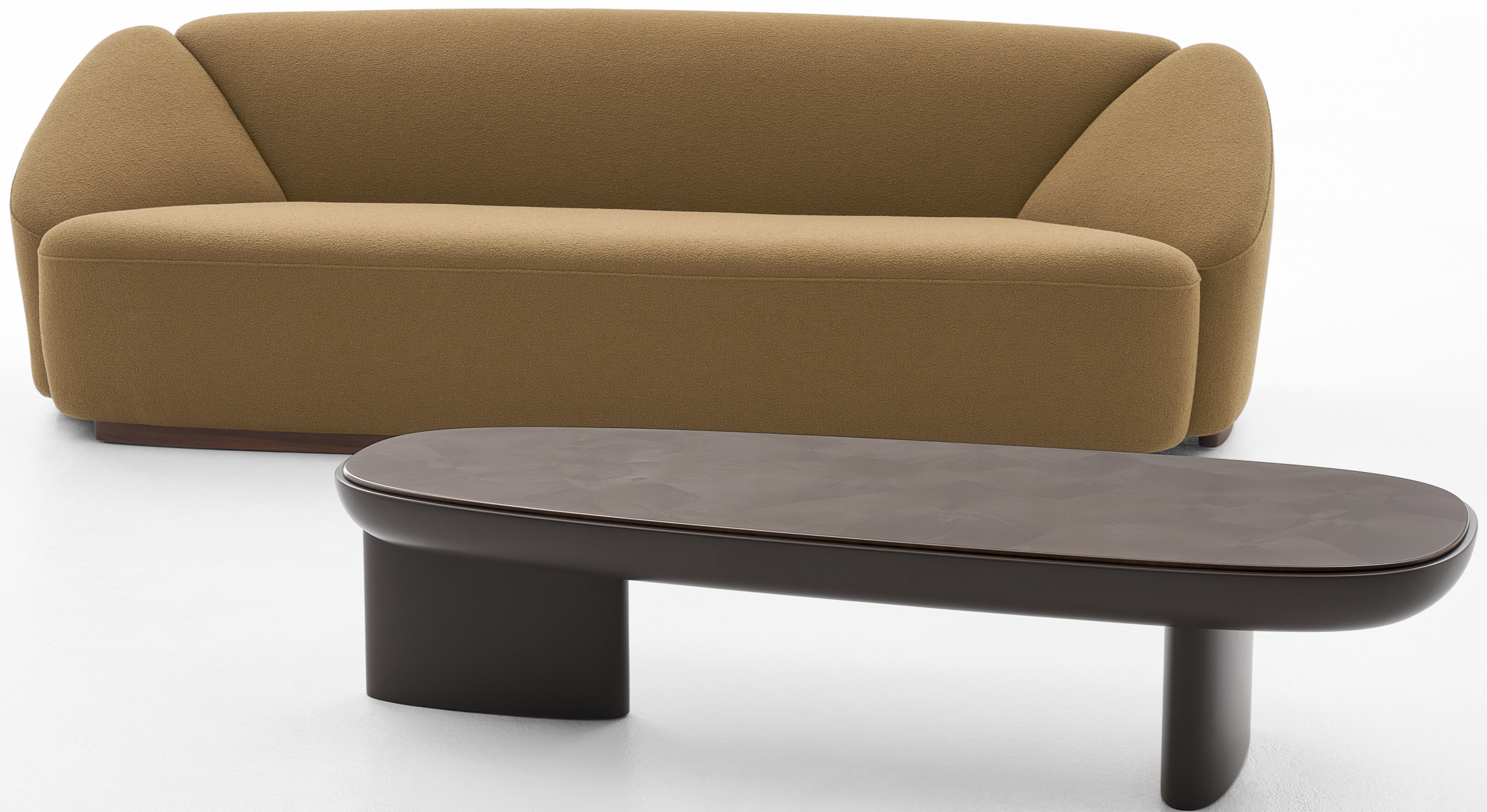
La table basse JIMMY 160 cm devant le canapé TRÈFLE 240 cm 63'' JIMMY coffee table in front of 94,5'' TRÈFLE sofa