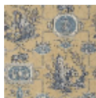
BP207003 Antique blue