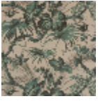
BP321003 Sous bois