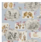
FP193003 Blue surf