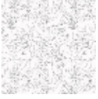
FP370001 Noiret blanc