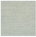
FP475002 Gris galet