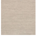
FP475012 Beige daim