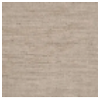
FP475004 Mer du nord