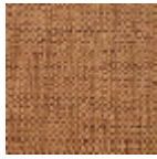
FP551011 Bois de rose