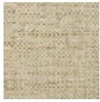
FP551004 Jonc de mer