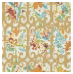
FP774001 Ete indien