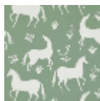
FP776002 Argile verte