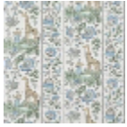
FP954001 Bleu aqua