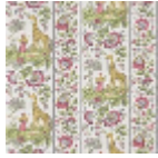
FP954002 Fuchsia anis