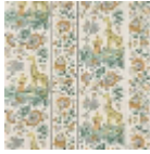
FP954003 Miel celadon