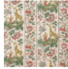
FP954004 Brique vert