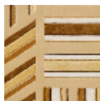
BT109002 Ocre jaune