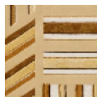
BT109002 Ocre jaune