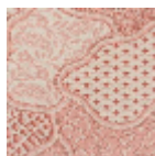
BT113002 Vieux rose