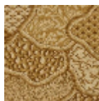
BT113003 Vieil or