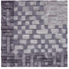
FT147001 Bleu pastel