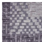
FT147001 Bleu pastel