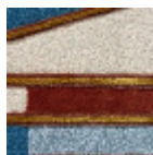
FT207002 Bleu nattier