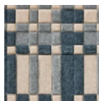
FT209003 Bleu gris