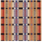
FT228001 MULTICOLOR E