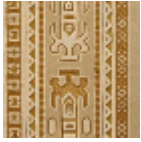
FT232002 Vieil or