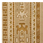
FT232002 Vieil or