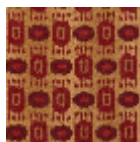
FT237003 Curry rouge