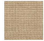
FT250007 Vieux rose