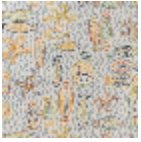
FT251001 MÉDITERRAN ÉE