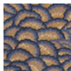
FT253001 Jaune d'or