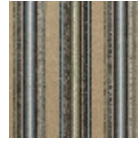
FT254003 Vert d'eau