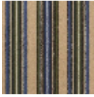
FT254001 Bleu marine