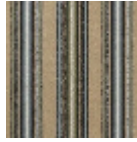
FT254003 Vert d'eau