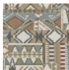
FT262002 Vert d'eau