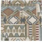
FT262002 Vert d'eau