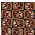
FT316003 TERRE CUITE