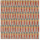
FT329001 RIVE DU NIL