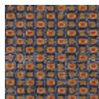
FT330001 RIVE DU NIL