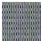
FT331001 RIVE DU NIL