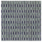
FT331001 RIVE DU NIL