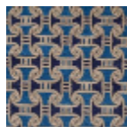
FT332001 RIVE DU NIL