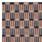
FT333001 RIVE DU NIL