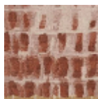
FT338002 TERRE D'EGYPTE