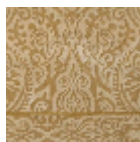
IT108003 Vieil or