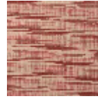
IT111005 Brique rose