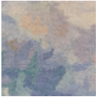
IT119001 ACQUA E CIELO