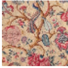
B080A003 Corail jaune