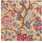
B080A003 Corail jaune