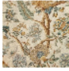
B080A004 Bleu or fond blanc