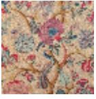
B080A001 Rouge fond crème