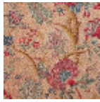
B080A002 Rouge fond bis