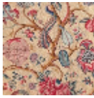
B080A003 Corail jaune