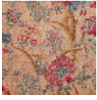
B080A002 Rouge fond bis