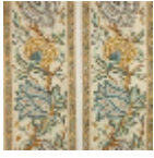
B080C004 Bleu or fond blanc