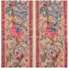
B080C001 Rouge fond crème