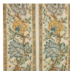
B080C004 Bleu or fond blanc