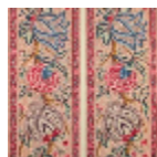
B080C001 Rouge fond crème