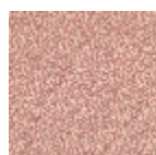
B081C001 Rouge fond crème