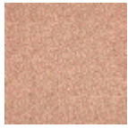
B081C002 Rouge fond bis