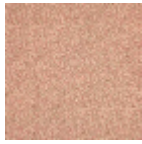
B081C002 Rouge fond bis