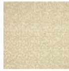
B081C004 Bistre fond blanc