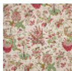
B1742002 Cretonne rouge vert