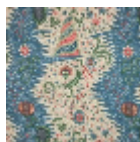
B1788006 Bleu fond crème