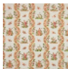
B1852003 Jaune corail