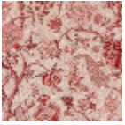
B1884001 Rose ancien