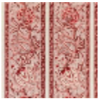
B1885001 Rose ancien