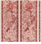
B1885001 Rose ancien